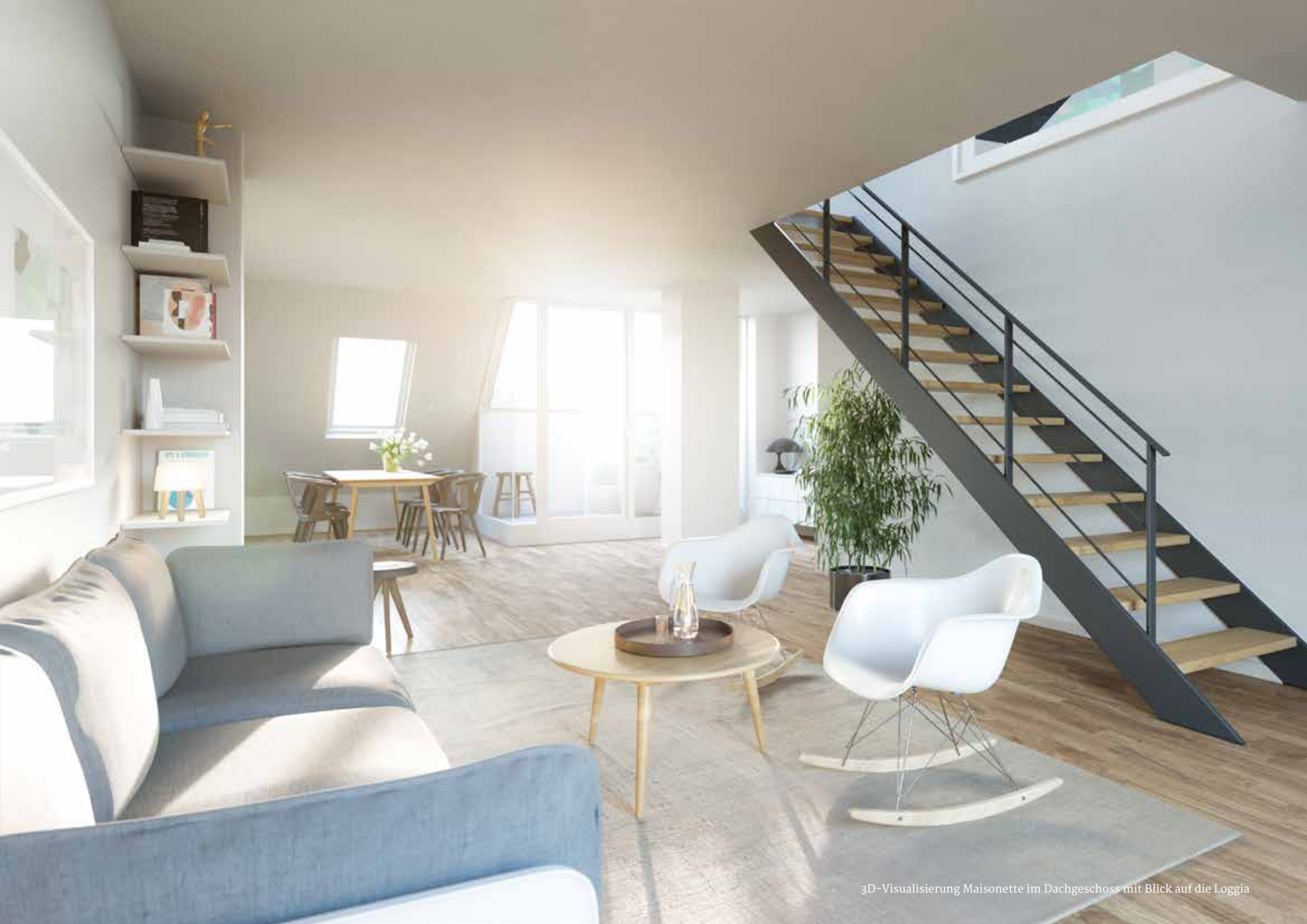
3D-Visualisierung Maisonette im Dachgeschoss mit Blick auf die Loggia